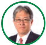
山口銀行頭取 吉村 猛