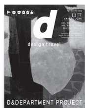
vol.9 d design travel 山口号

2019年6月29日(土) 14:00-16:30(受付・開場 13:30) 会場：下関市生涯学習プラザDREAM SHIP(山口県下関市細江町3-1-1) 第1部：『d design travel』発行人のナガオカケンメイ氏による講演 第2部：6つのグループに分かれて山口県下関エリアのおすすめスポットをディスカッション 参加費：無料 ※参考資料として『d design travel YAMAGUCHI』号(1,512円)を販売いたします。 定員：80名 ※定員を超えた場合、抽選になる可能性があります。 持物：筆記用具