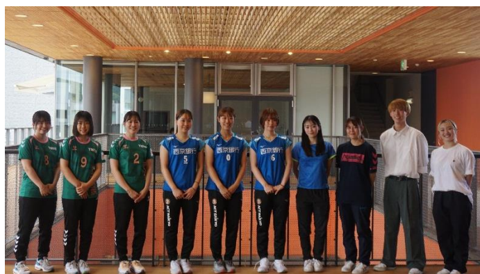
(出演者全員での記念撮影)